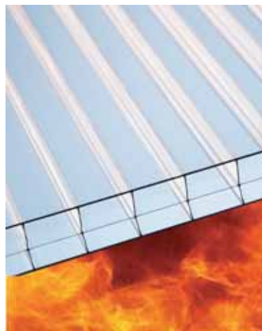
Makrolon® multi UV FR