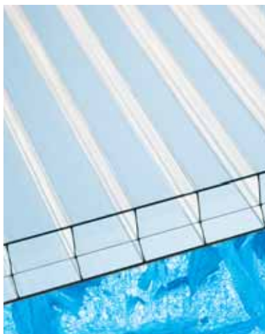
Makrolon® multi UV HR